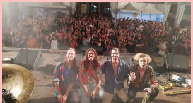
Concert a Festes de Gràcia, 2018

R - Doncs no ho sabem, perquè ara mateix estem una mica parats en aquest sentit. Ens estem centrant en altres coses com ara gravar nous temes i fer un videoclip!