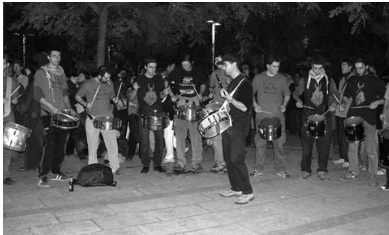
Actuació del Timbalers de la Colla Vella durant els Foguerons d'enguany.