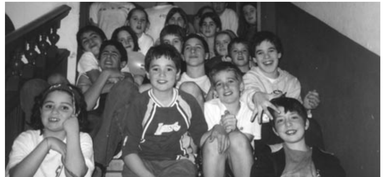
Participants del Ier Campus bàsquet