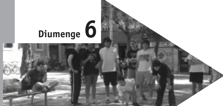
Diada de l'Esport organitzada pel GMM