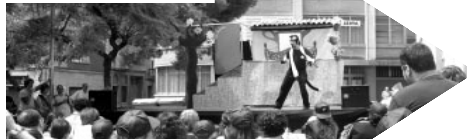
Festival de Titelles Amb la participació de les companyies: L'Estenedor, Galiot Teatre, Xip Xap Titelles i El forat del Niu