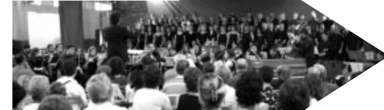
Concert de Sant Lluís Amb la participació de les corals Cantiga, La Fuga, Sinera, Vent del Nord i El Vioiolet