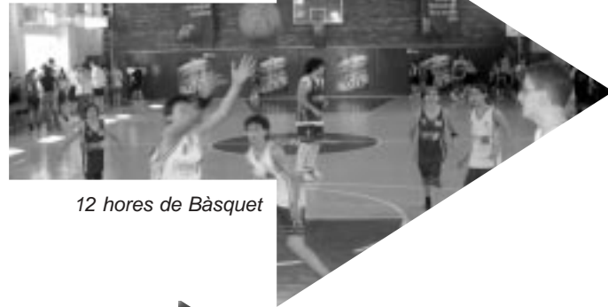
12 hores de Bàsquet