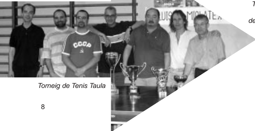
Torneig de Tennis Taula