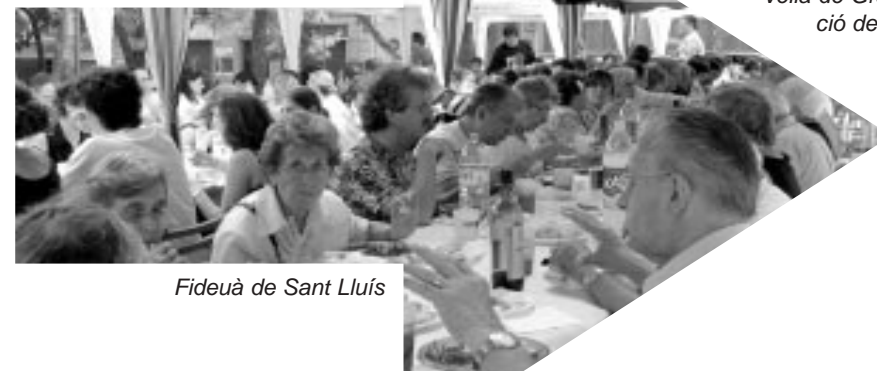
Fideuà de Sant Lluís