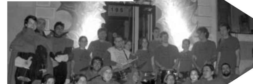
La porta de l'infern Amb la Colla de Diables La Vella de Gràcia i la col·laboració de Sotacabina Teatre