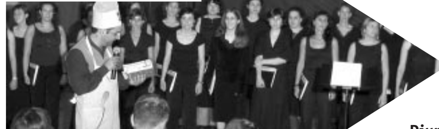
Concert 5è aniversari Coral La Fuga