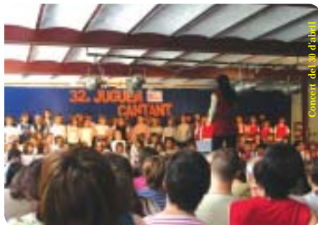
Concert del 30 d'abril

I tot allò que comença s'acaba! Així que a reveure i fins l'any que ve... o fins demà, que el Juguem Cantant no va descansar i l'endemà va continuar per acollir a un altre grup de corals, que pel que m'han dit, també va anar molt bé. En tot cas, nosaltres desitgem repetir aquesta experiència el proper curs.