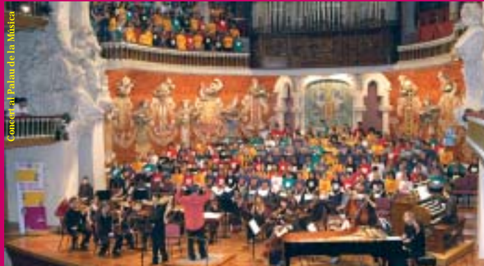
Començament del concert al Palau de la Música

Dit i fet. A partir d'aquí tothom es va posar a treballar. Vam decidir quins moviments cantaria cada grup, com faríem el muntatge, com resoldríem qüestions de logística... i mil aspectes més que sempre