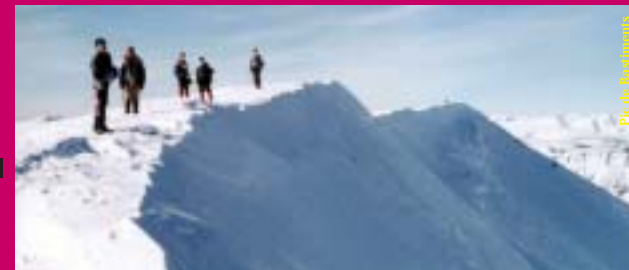
Pic de Bastiments