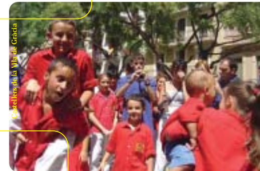
Castellers de la Vila de Gràcia