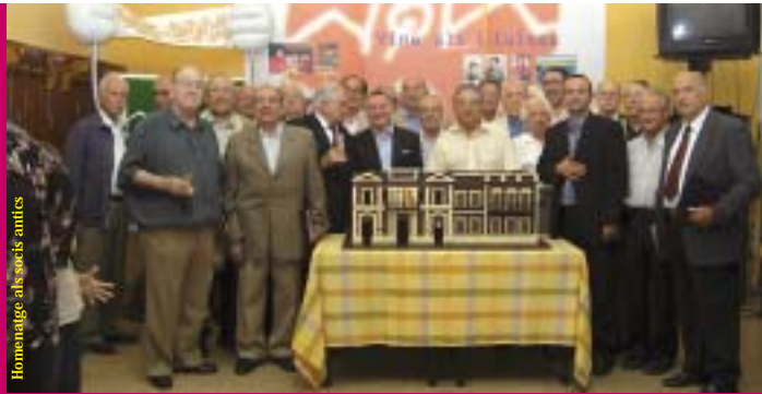
Homenatge als socis antics