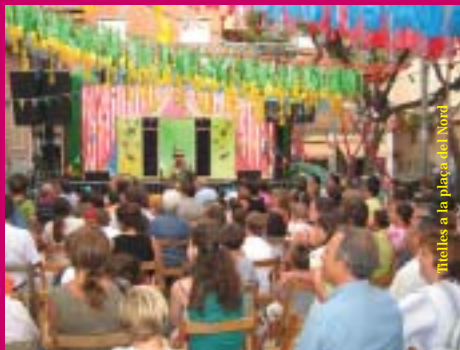
Titelles a la plaça del Nord