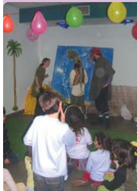
Festa d'aniversari celebrada als Lluïsos