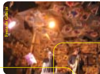
Festa de Gràcia