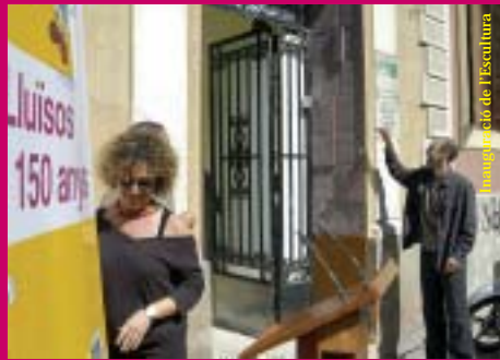
Presentació de l'escultura