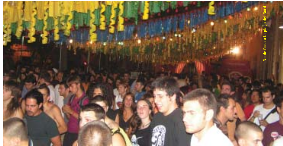
Nit de festa a la plaça del Nord