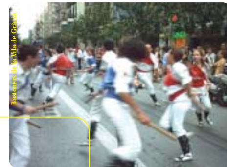
Bastonera de la Vila de Gràcia