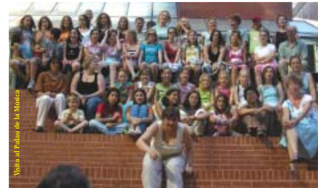
Visita al Palau de la Música

Va ser una experiència molt interessant la de conèixer gent d'un altre país i poder-nos relacionar amb persones de costums diferents del nostre.