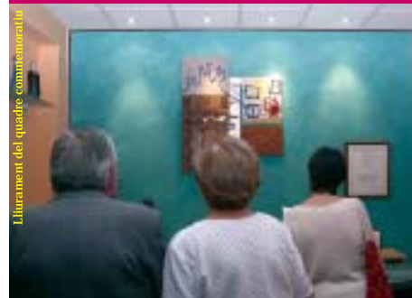
Lliurament del quadre commemoratiu