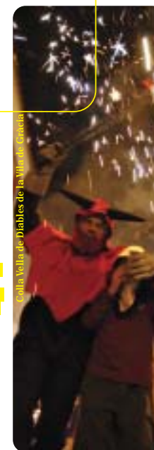
Colla Vella de Diabla de la Vila de Gràcia

immensa sardina del carrer Tordera, ens oferien l'altra cara d'una moneda -molt negativa- que voldriem eradicar per sempre de la Festa Major de Gràcia. Tot plegat va culminar amb un fet sense precedents: la tarda del dissabte darrer de la festa, un important nombre de graciencs i graciencques ens vàrem manifestar amb una única pancarta: "La Festa no és violència" , i amb un únic propòsit: la reivindicació, l'exigència d'una festa en pau.