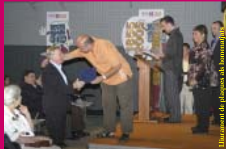
Lliurament de plaques als homenajejats

Vila de Gràcia. Es tracta d'una intervenció a la porta d'entrada de l'entitat en la qual s'ha folrat tota la volta amb una voluntat de deixar petjada concreta, en forma de recordatori al pas del temps, a les vivències i sentiments i el lligam amb el territori que ens ha acollit. Els materials utilitzats han estat ferro colat i ceràmica. S'han reproduït tot un seguit de testimonis gràfics de socis i amics, recollits a la sortida a Montserrat del passat 1 de maig. Cada vegada que entrem i sortim dels Lluïsos tindrem present aquesta aportació i commemoració.