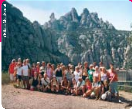
Visita a Montserrat