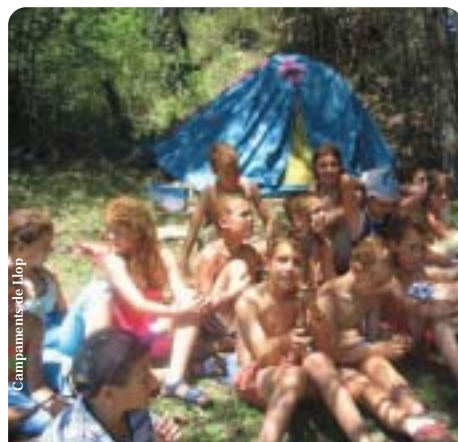
Campaments de l'11op

Creieu-me quan us dic que és molt millor viure-ho que llegir-ho.