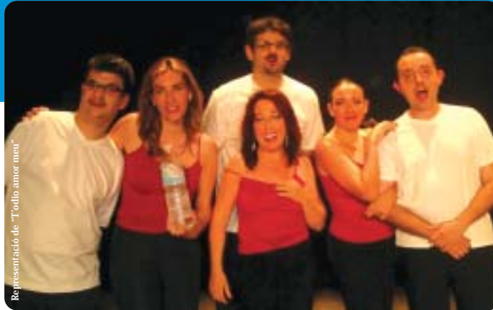
Representació de "T'odio amor meu"

Al final de cada escena vam incloure un número musical en playback i alguns passos bàsics de ball que van fer de l'obra una comèdia divertida i lleugera que va fer somriure el nostre