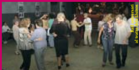
Ball d'aniversari al teatre dels Lluïsos