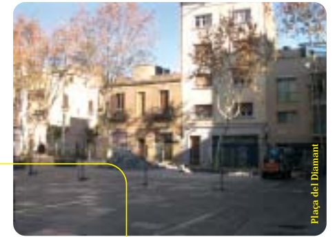
Plaça del Diamant