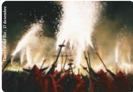
Correfoc del 25è, 17 desembre

Recull 25 escrits de gent de la colla, d'altres que no ho són, d'altres que no ho volen ser però sempre hi són, en fi, gent que sent una emoció quan escolta el nom de la Vella. Si voleu saber què blasfemen no us ho penseu, mireu-la, gaudiu-ne, i no l'oblideu.