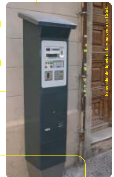
Exposador de lliquets de la zona verda de Gràcia