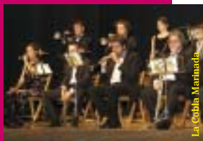
La Cobla Marinada