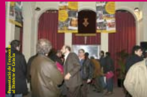
Presentació de l'exposició al Districte de Gràcia