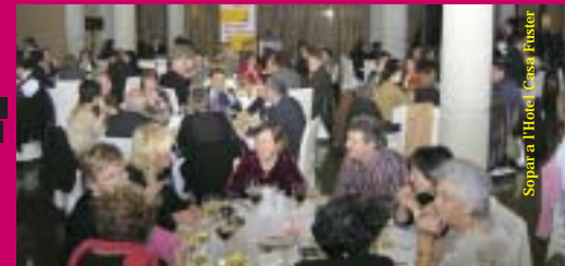
Sopar a l'Hotel Casa Fuster