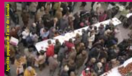
Aperitiu popular de l'acte de cloenda