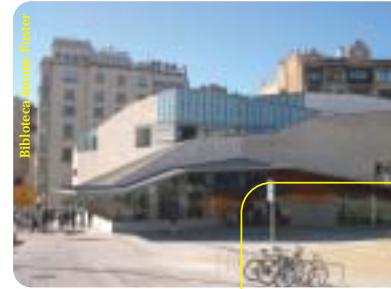
Biblioteca Jaume Fuster

De mobilitat se n'ha parlat molt els darrers mesos: Ajuntament, Districte i ciutadania; als despatxos i al carrer; als mitjans de comunicació... S'ha arribat a difícils acords sobre l' aplicació del Pla de Mobilitat , l'anomenada "macroilla" o la implantació de canvis i modificacions en diversos sentits circuladors de carrers. S'ha estrenat l' Àrea Verda i s'ha conegut la voluntat política i veïnal de convertir en peatonal el carrer Astúries , un dels més transitats de la vila.