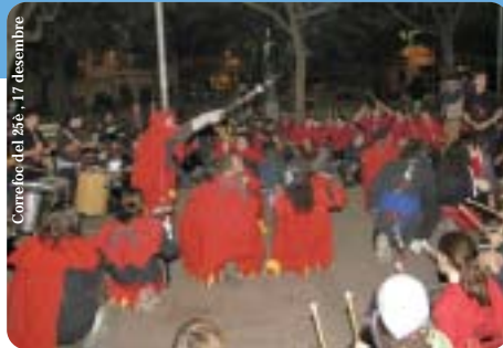
Correfoc del 25è, 17 desembre

L'11 d'octubre va ser la data escollida per iniciar el recorregut de l'exposició del 25è, que durant aquest any s'allotjarà a diversos centres de la vila. El tret de sortida es va donar als Lluïsos, actual infern de la colla, i preveu cremar les parets de la Biblioteca vila de Gràcia, Districte, la Violeta, entre altres.