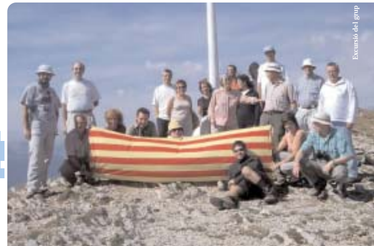
Excursió del grup

Properament, per al 12 de febrer de 2006, estem preparant una visita col·lectiva (oberta a tothom) als Aiguamolls de l'Empordà, per a la qual comptem amb l'acompanyament d'uns experts de DEPANA. Ben aviat rebreu informació més concreta d'aquest esdeveniment.