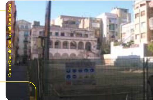
Carrer Gran de Gràcia amb Santa Rosa

I anem acabant: els mossos s'han desplegat per Gràcia i varen rebre la benvinguda oficial del Districte amb l'obsequi d'una bandera de la vila. I, pel que fa a les entitats esportives, un parell de clarsos. El clar, evidentment, el nou local de la Unió Excursionista de Catalunya-Gràcia al carrer Encarnació, una magnífica aposta de futur possible per la generosa herència rebuda del matrimoni Planas, socis de l'entitat. I l'obscur, la greu crisi del Club Natació Catalunya que travessa, a punt del seu 75è aniversari, un dels pitjors moments de la seva història.