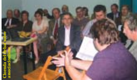
Cloenda del debat sobre associacionisme