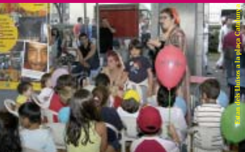
Estan dels Lluïsos a la plaça Catalunya