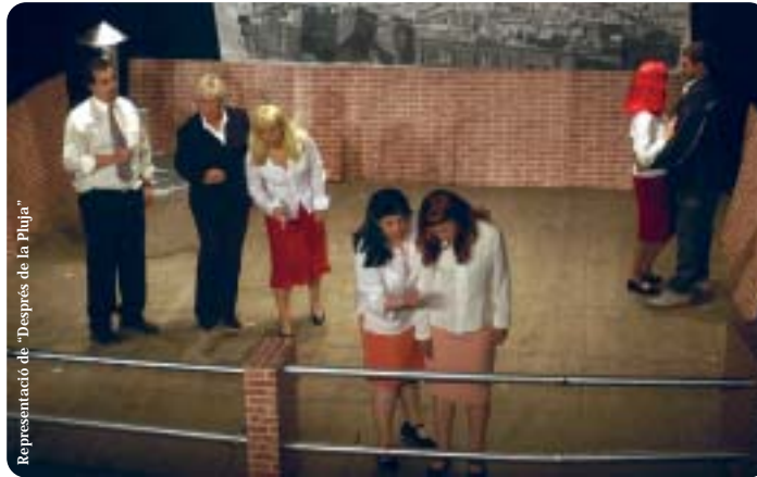
Representació de "Després de la Pluja"

públic. Això demostra que dins el funcionament d'una companyia amateur com la nostra cal estar preparat per qualsevol imprevist i saber optimitzar al màxim els recursos que es tenen. I en aquesta companyia ha quedat més que palès l'interès perquè els projectes tirin endavant i la col·laboració per part de tots.