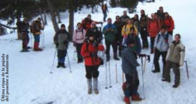
Última etapa de la pujada del pessebre a Bastiments