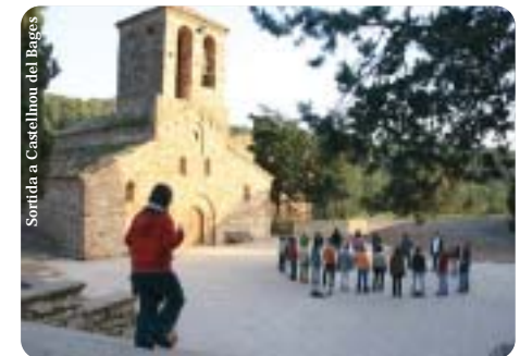
Sorridia a Castellnou del Bages